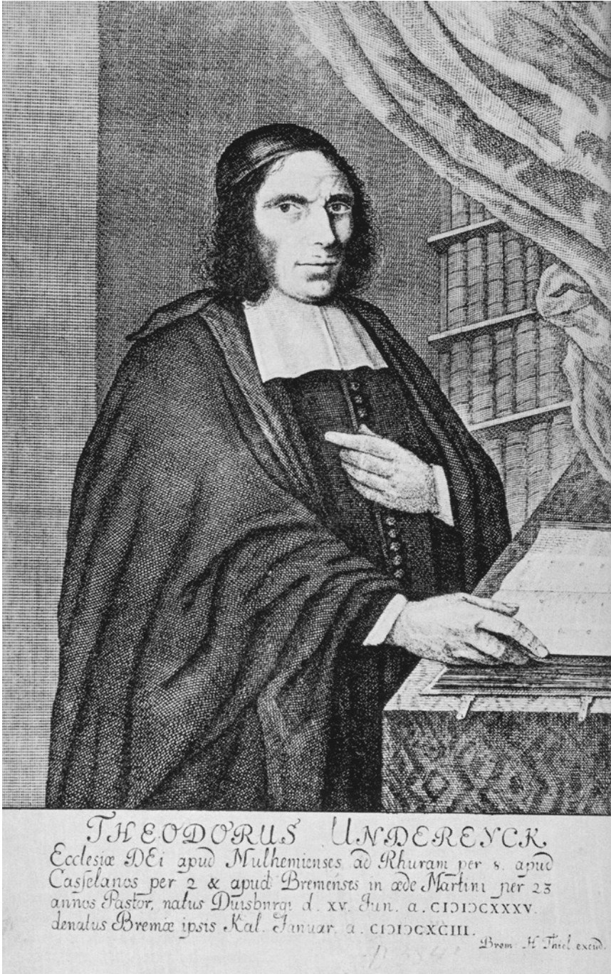
Abbildung 1: Theodor Undereyck (1635–1693) Focke-Museum Bremen D.0354c