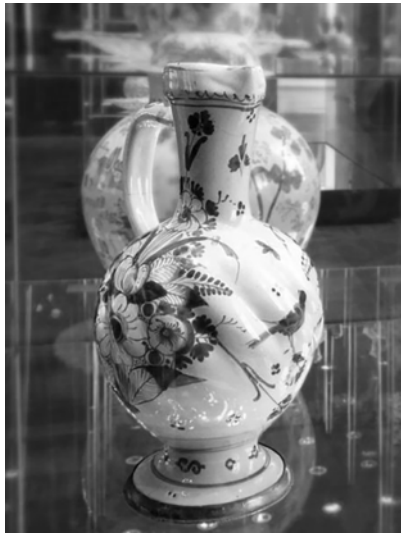
Abbildung 3: Enghalskrug aus Hanau, um 1700.

Präsentiert im Historischen Museum Hanau Schloss Philippsruhe.