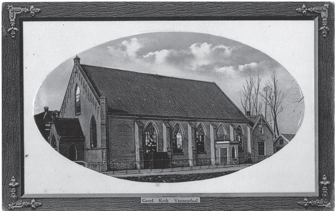
De gereformeerde kerk aan de Kerkewijk, circa 1910

van 1895, samengesteld uit fragmenten van de liturgische formulieren, bevatten enkele explicaties die een piëtistische weifelende ziel voor gewetensproblemen konden plaatsen. In de derde vraag gaat het over een zondaar die zich 'bewust' is midden in de dood te liggen, die zijn zaligheid buiten zichzelf in Jezus Christus zoekt en dat hij deze Middelaar 'door het geloof' zoekt aan te nemen. De vierde vraag eindigt met het 'hartelijk voornemen' van de belijdeniskandidaat om met de christelijke gemeente te volharden 'in de gemeenschap en in de breking des broods'. De Veenendaalse vragen vereisten een 'belijdenis des geloofs' in eigenlijke zin. Dat leverde bij veel piëtistisch ingestelde gemeenteleden die belijdenis af wilden leggen zwaarwegende bezwaren op.