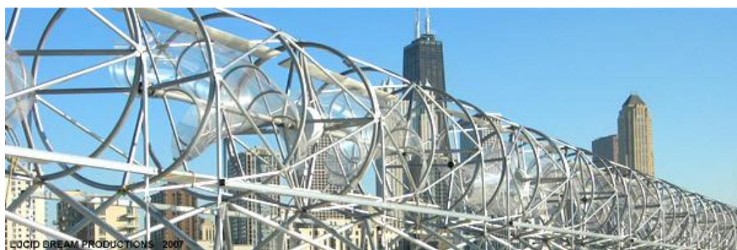
Figuur 5.4 Windturbineslang, roterende segmenten, te plaatsen in de windsandwiches onder de zonnepanelen en tussen de bovenste bouwlagen.

In het nieuwe systeem blijft de noodvoorziening voor VUmc uiteraard bestaan. Een andere moeilijkheid zijn de piekuren van de VU. Mocht de VU haar eigen elektriciteit gaan produceren, dan moet het wel aangesloten blijven op het net. Overproductie opslaan is eventueel een optie. Wellicht verdient het aanbeveling om in het kader van het besparingsbeleid over te schakelen van wisselstroom op gelijkstroom.