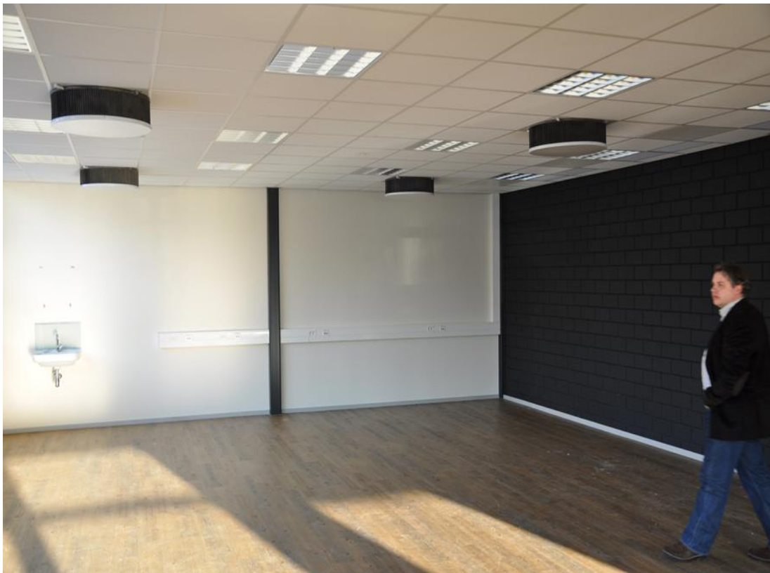
Figuur 5.2 Een duurzaam warmteafgiftesysteem: de Fiwihex warmtewisselaar, in de TU-Delft.

Andere mogelijkheden voor energiezuinige gebouwen zijn bijvoorbeeld betonkernactivering (het gebouwcasco gebruiken als warmtebuffer), dubbele gevels met natuurlijke ventilatie, binnenruimtes overdekken tot atrium en het gebruik van groen voor klimaatregulering (luchtzuivering, akoestische buffer). Daarnaast kan bijvoorbeeld voor binnenruimten in nieuwe en voor bestaande gebouwen gebruik gemaakt worden van fijnradige warmtewisselaars FIWIHIX. Hierbij gaat het in alle gevallen om bewezen technologie. Er zijn dus vele mogelijkheden beschikbaar. In het te ontwikkelen scenario kan de beste combinatie van technieken worden gekozen.