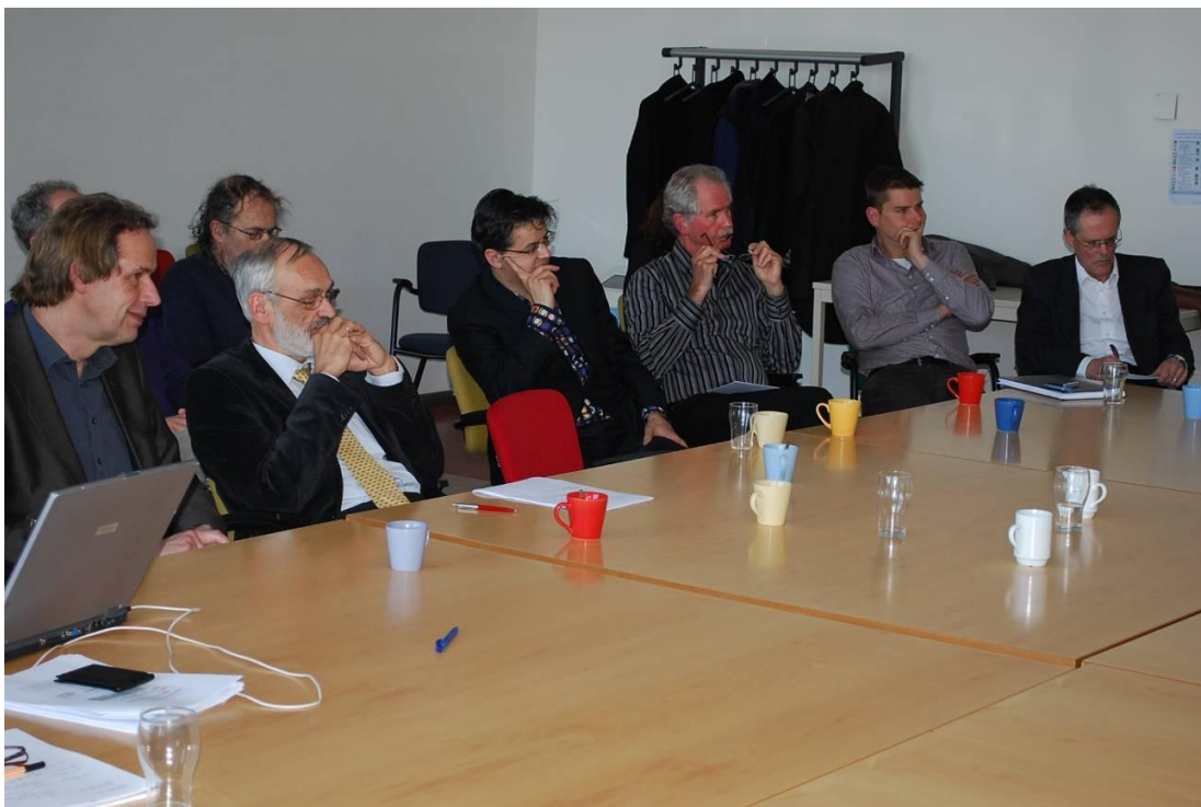
Figuur 2.1 De dialoog aan het werk.

In de tweede fase werd de dialoog gevoerd. De dialoog vond enerzijds plaats tussen de expertgroep (wat is er nu al mogelijk?) en de dialooggroep (wat willen wij nu eigenlijk?), anderzijds tussen de betrokkenen uit de expert- en dialooggroep samen. De dialoog heeft met de gevolgde werkwijze twee producten opgeleverd. Enerzijds ligt er een concept missie statement voor een duurzame VU. Anderzijds ligt er een ambitieuze visie met betrekking tot de wijze waarop duurzaam werken aan een nieuwe campus ook een duurzaam energiesysteem kan opleveren. Daarnaast deed het projectteam onderzoek naar de stand van zaken bij de verduurzaming van andere universiteiten in Nederland en internationaal. Ook de bevindingen hiervan zijn in deze brochure verwerkt.