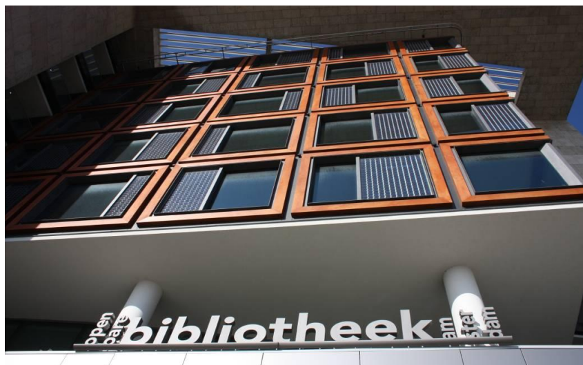
Figuur 3.4 De Openbare Bibliotheek Amsterdam, een voorbeeld van duurzaam bouwen. De nieuwe centrale bibliotheek op het Oosterdokseiland heeft de prijs voor het meest duurzame publiek toegankelijke gebouw van Amsterdam gekregen. De prijs is ingesteld door Dutch Green Building Council, Kinderen van Nu, de gemeente Amsterdam en de Provincie Noord-Holland. De prijs werd uitgereikt op het Nationaal Sustainability Congres (november 2008).