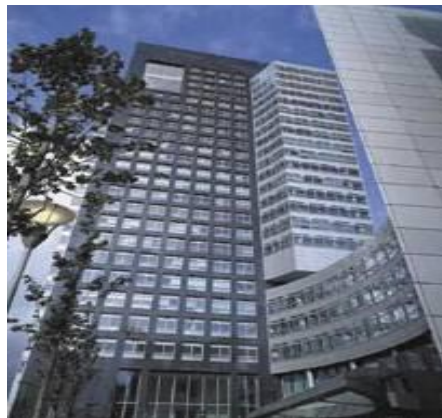
Figuur 3.5 Hoofdkantoor ABN-AMRO, trendsetter in de Zuidas.

Speciale aandacht is er voor de ontwikkeling van de Zuidas, waarin ook de campus van de VU is gesitueerd. Het Duurzaamheidsplan Zuidas, dat ook door de VU is onderschreven, stelt als een van de doelen om zo dicht mogelijk een situatie van CO 2 -neutraliteit te benaderen, en hiervoor een adequate minimumnormering op te nemen. De duurzaamheidopgave behelst onder meer de doelstelling om uiterlijk vanaf 2012 alle bebouwing te realiseren volgens hoge internationale duurzaamheidscriteria.