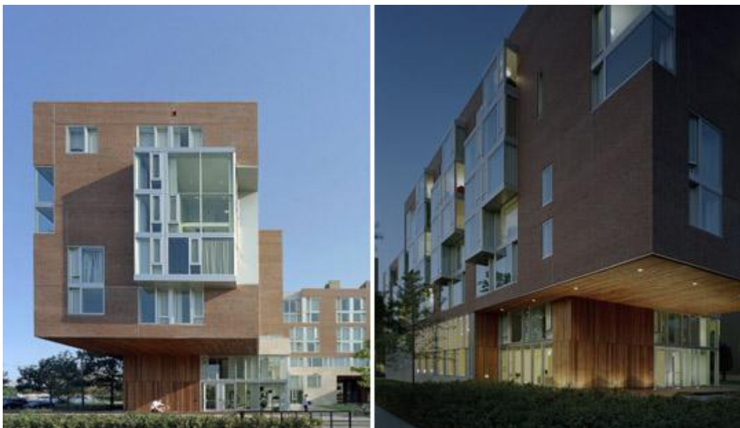
Figuur 3.1 Harvard's Green Graduate Student Residence; Kyu Sung Woo Architects.

Ambitieuze universiteiten zijn bezig om “klimaat”- of “CO 2 ”-neutraal te worden. Er is evenwel nog geen universiteit in geslaagd om deze ambitie volledig te realiseren. Door bij deze ambitie aan te sluiten, toont de VU leiderschap op een onderwerp dat internationaal onderscheidend is. Dit is op termijn onmisbaar voor de internationale reputatie van de universiteit. Zoals Sijbolt Noorda, voorzitter VSNU, het heeft verwoord: “Duurzaamheid is tegelijk een economische kans en een economische noodzaak” .