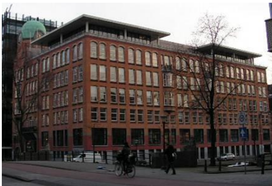
Figuur 5.3 De Diamantbeurs, tot voor kort het kantoor van de Dienst Milieu en Bouwtoezicht Amsterdam.

Het warmtesysteem dat wordt voorgesteld is niet alleen goed mogelijk voor nieuwbouw, maar ook voor bestaande bouw. Tabel 5.1 vat een scenario samen dat werd doorgerekend voor de voormalige Diamantbeurs aan de Amsterdamse Weesperstraat, een monumentenpand in de grachtengordel.