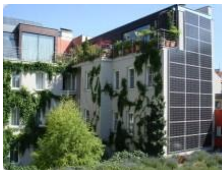
Figuur 5.1 Boutique-Hotel Stadthalle Wien. Behalve van zonnepanelen voor de opwekking van elektriciteit maakt dit hotel gebruik van muurverwarming.

Eigen voorziening van warmte en koude is duurzamer en goedkoper dan het inkopen van bijv. stadswarmte. VU en VUmc maken de overgang naar een systeem van Zeer Lage Temperatuur Verwarming. Dit betekent dat in de toekomstige situatie via daken, ramen en muren warmte gewonnen wordt gedurende de zomer en eventueel koude in de winter. Warmte en koude worden opgeslagen onder de grond in een warmte koude opslag (wko).