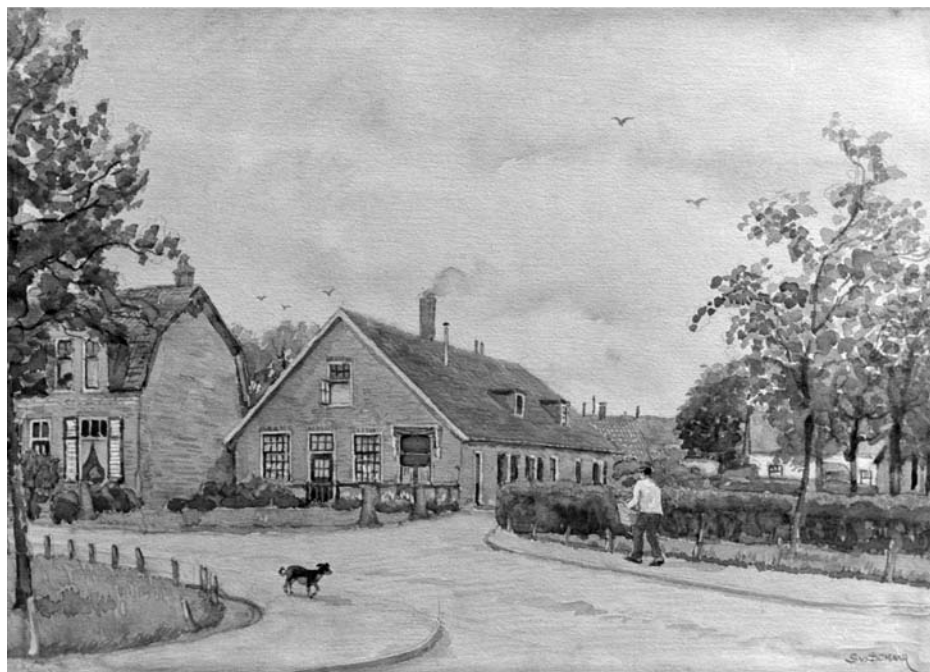
De boerderij midden op het schilderij bestond in de dertiger jaren uit drie huizen met de nummers Langeweg 4, 6 en 8 te Blaricum. Gawehn woonde in het middelste huis. Het huis heeft nu een rieten dak en omvat twee huizen met twee huisnummers: 6 en 8.

In Amsterdam gaat het volgens Freudenthal definitief mis. In een interview in de tachtiger jaren zegt hij het volgende: “Eind 1930