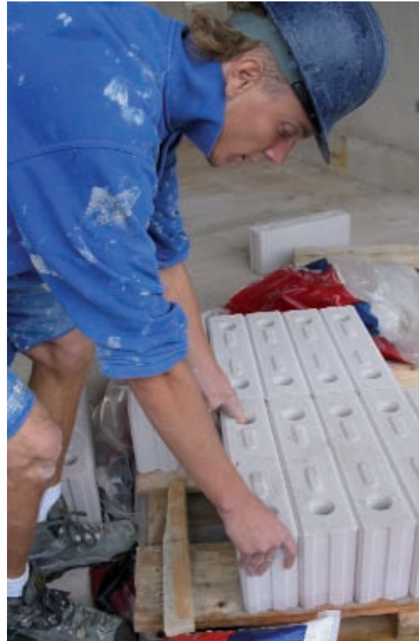
Figuur 1. Een blokkensteller tijdens het oppakken van een blok uit de derde rij van de onderste laag blokken.

De meeste ergonomen hanteren de NIOSH-formule voor het beoordelen van de zwaarte van tilsituaties en om de effectiviteit van maatregelen te evalueren. Deze studie laat zien dat voor de evaluatie van maatregelen in de praktijk ook gebruik kan worden gemaakt van de regressievergelijkingen van Potvin (1997). Een nadeel van deze regressievergelijkingen is dat de maximale compressiekrachten worden