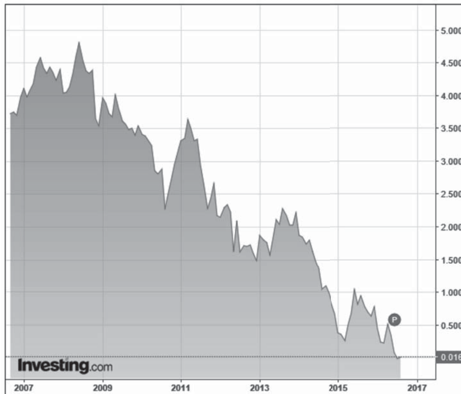
Figuur 1: verloop van de 10-jaars Nederlandse staatsobligatie

Nederland 10-Jaar, Nederland, Amsterdam:NL10YT=RR, M