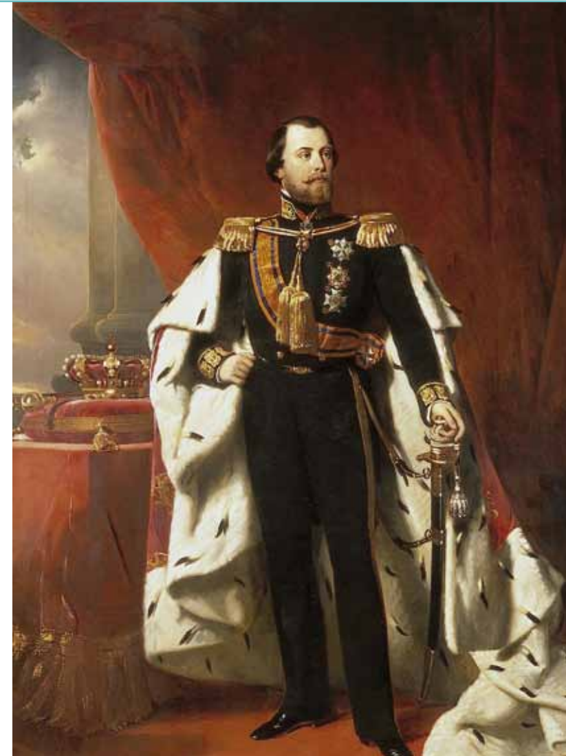
Koning Willem III in 1856 geportretteerd door Nicolaas Pieneman

Nadat de Tweede Kamer de Onderwijswet aannam, vervolgden de Tilburgers hun actie op 21 juli met hun petitie aan de Eerste Kamer en de koning. Met eenzelfde geestdrift werden de handtekeningen opgehaald, op 28 juli stond de teller op 3108 namen. Voor wie nog geen gelegenheid had gehad om te tekenen was er nu ook de mogelijkheid om bij boekhandelaar W. Bergmans te tekenen. Uiteindelijk tekende precies de helft van de volwassen katholieke mannen in Tilburg, 3826 in totaal. De Tilburgsche Courant sprak haar trots uit over dit aantal, want de aantallen van Tilburg behoorden tot de top van de gemeentes.