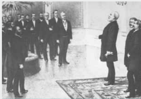
foto boven: De petitie wordt in 1878 aangeboden aan koning Willem III. foto rechts: Abraham Kuyper staat algemeen bekend als aanjager van de petitiebeweging – voor protestants lager onderwijs. De katholieke opinieleiders volgden zijn initiatief en mobiliseerden ook de katholieke bevolking.