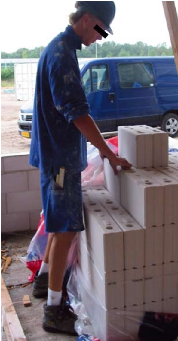
Afbeelding 3. Werkplek op de bouw waar metingen met de rolmaat werden uitgevoerd

van deze zogenoemde statische veldmethode werden vergeleken met de uitkomsten van het laboratorium-experiment beschreven in de eerste studie van het proefschrift, waarbij gebruik was gemaakt van een 'state of the art' dynamische analyse van de rugbelasting (dynamische laboratoriummethode). Uitkomsten van de tweede veldstudie gaven aan dat de statische veldmethode een goede methode is voor het meten van de effecten van ergonomische interventies.