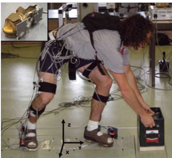
Afbeelding 5. Validatie-experiment voor het meten van grondreactiekrachten met krachtschoenen. Metingen met krachtschoenen werden vergeleken met de metingen van krachtenplatforms

Wanneer krachtschoen en IMS-metingen gecombineerd worden, zou met behulp van de gemeten grondreactiekrachten en de gemeten kinematica van