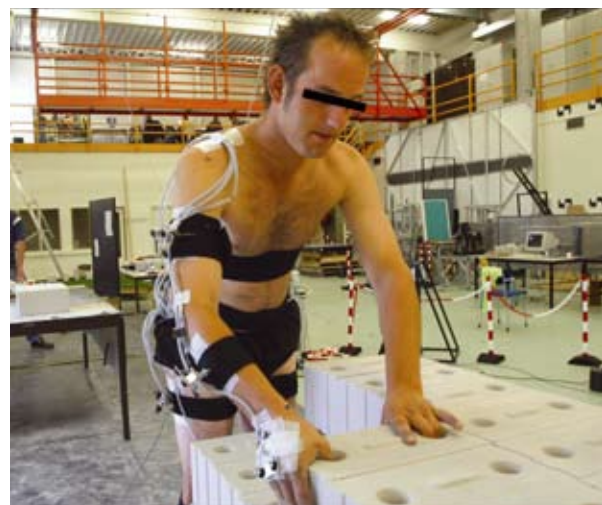
Afbeelding 1. Bouwvakker tilt bouwblokken in nagebootste werksituatie

In de eerste studie (Faber e.a., 2007) werd in het laboratorium het effect van drie ergonomische interventies bij het handmatig tillen van lasten onderzocht: verlaging van tilgewicht, verhogen van de hoogte van het te tillen gewicht en verkleinen van de horizontale afstand tot het te tillen gewicht. In tegenstelling tot de meeste laboratoriumexperimenten, werden de tiltaken uitgevoerd door ervaren bouwvakkers in een nagebootste werksituatie (figuur 1) en waren de bouwvakkers vrij om te tillen zoals ze normaal doen tijdens hun dagelijks werk. De resultaten van dit onderzoek lieten zien dat de bouwvakkers, als reactie op de ergonomische interventies, hun tilstrategie over het algemeen zo aanpasten dat de beoogde effecten van de interventies op de rugbelasting werden verzwakt. De bouwvakkers reikten bijvoorbeeld verder en tilden sneller bij een licht bouwblok dan bij een zwaar bouwblok. Verder werd er, in tegenstelling tot in voorgaande laboratoriumstudies, geen effect op de rugbelasting gevonden van het verkleinen van de horizontale positie van de last bij het tillen van bouwblokken laag bij de grond. Het is onduidelijk of dit verschil in bevindingen tus-