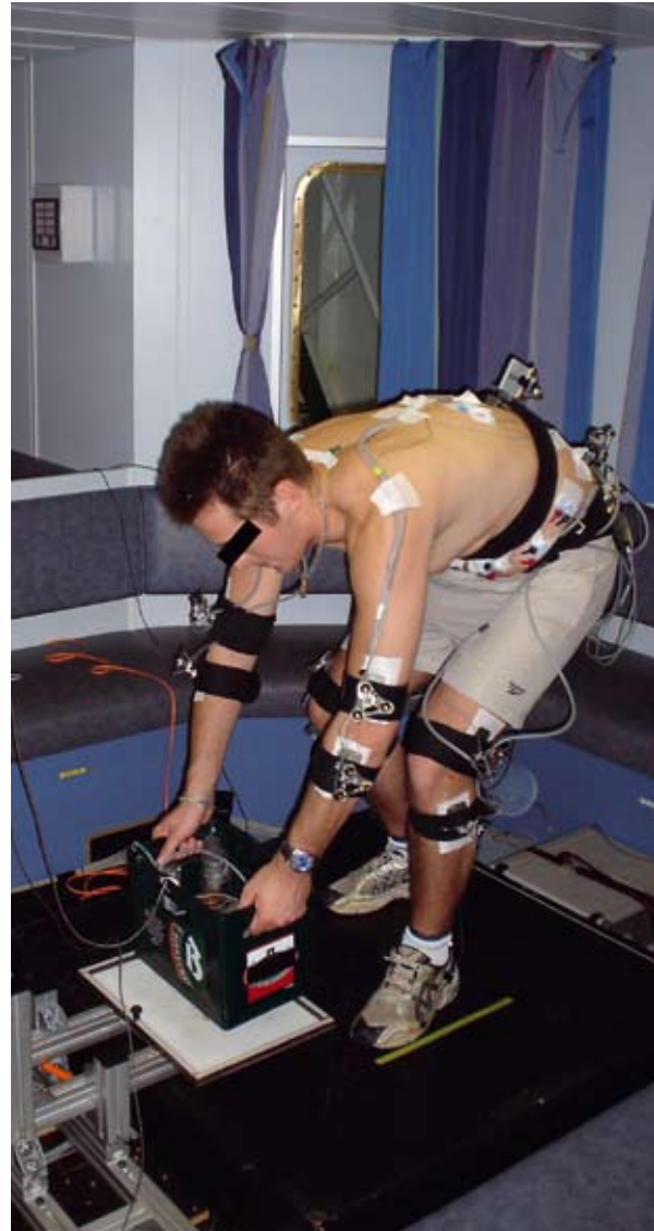
Afbeelding 2. Laboratoriummeetmethoden voor het bepalen van rugbelasting toegepast bij metingen op een schip

In de eerste veldstudie (Faber e.a., 2008) werden metingen verricht in een schip varend op zee. Hierbij werd gebruik gemaakt van meetapparatuur (krachtenplatform en bewegingsregistratiecamera's)