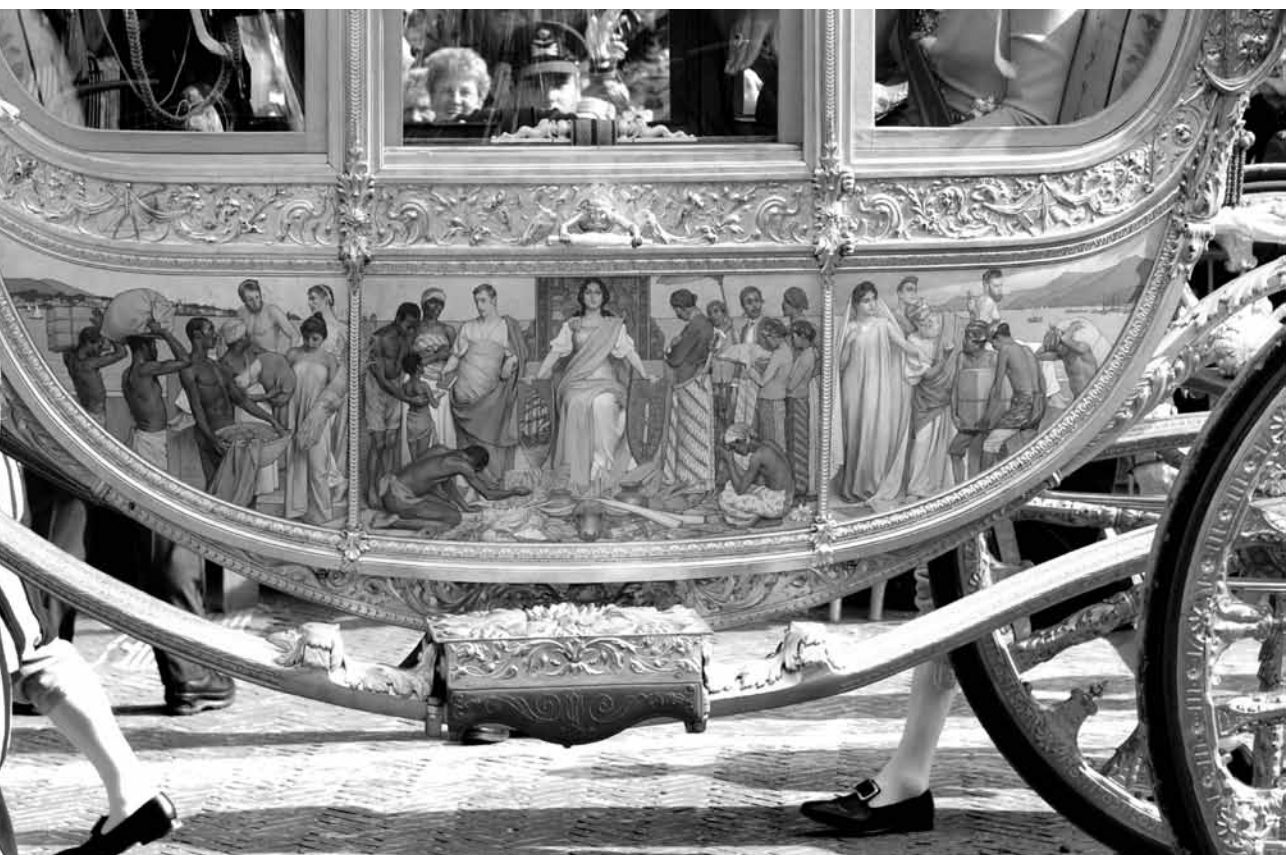
▲ Pieter Hiltz, Zijpaneel van de gouden koets 'Hulde der Koloniën'. Hollandse Hoogte, Amsterdam.